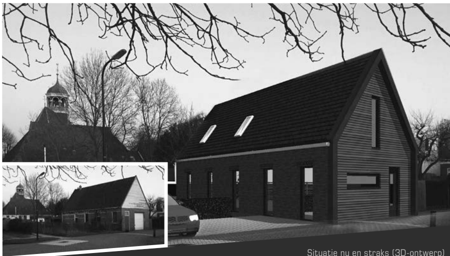
Situatie nu en straks (3D-ontwerp)